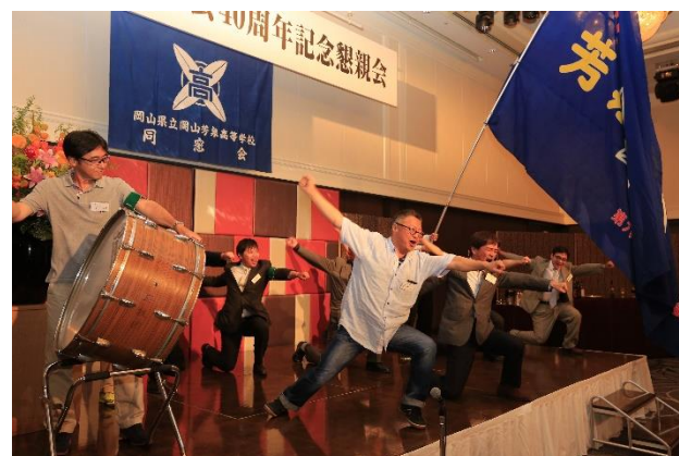
歴代応援団員によるエール