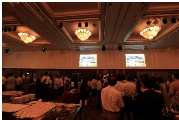
オープニングで壁面に映し出された母校の映像