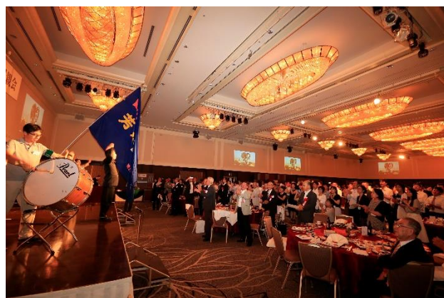
応援団の指揮の下、校歌斉唱